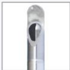
Descolador Cortador Moderado - DCM