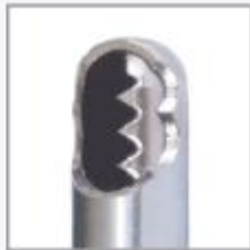
Agressivo Cortador de Cartilagem - ACC