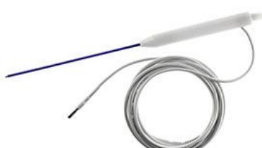
eletrodos de sucção

eletrodos reutilizáveis, eletrodos antiaderentes