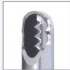
Agressivo Cortador de Cartilagem Small - ACCS