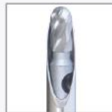
Debridador Oval - DOA