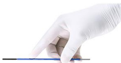
eletrodos de faca