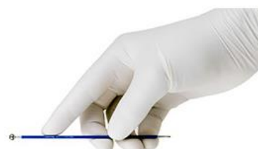
eletrodos de bola e micro bola

eletrodos reutilizáveis, eletrodos antiaderentes