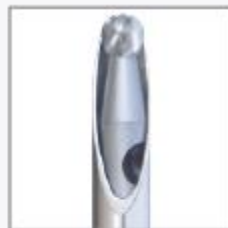
Debridador Redondo Reto - DRR