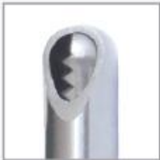
Moderado Cortador de Cartilagem - MCC