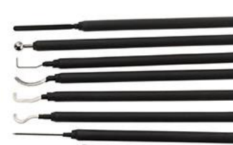
eletrodos de laparoscopia

eletrodos reutilizáveis, eletrodos antiaderentes