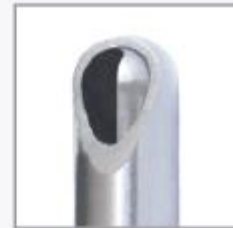
Moderado Cortador de Cartilagem Small - MCCS